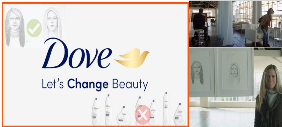
شكل رقم (١٣) حملة دوف Dove Real Beauty Sketches

مثال حملة Dove Real Beauty Sketches : والتي جعلت شركة Dove تبدو أكثر مصداقية في رسائلها التسويقية والتي نجحت في موازنة مهمتها المتمثلة في مساعدة النساء على تطوير علاقة إيجابية بمظهرهن وجهودها التسويقية الخاصة. لقد كانت الحملة الإعلانية الأكثر انتشارًا مشاهدةً في عام ٢٠١٣ مع ما يقرب من ١٣٥ مليون مشاهدة ، شركة Dove حولت نفسها من مجرد شركة صابون إلى شركة ذات رؤية. كان بيان مهمتهم الجديد هو أن "الجمال يجب أن يكون مصدرًا للثقة وليس القلق". لقد تمكنت دوف من تغيير تصورها العام إلى علامة تجارية تدافع بشكل أصيل عن تمكين المرأة وتريد تغيير المحادثة حول الجمال .