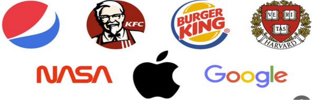
شكل (٦) استخدام الرموز في تصميم الهوية البصرية للبراند

الفعلي من العلامات التجارية هو تفسيرها على أنها صور رمزية، وبناءً على هذا الرأي، يتم استهلاك العلامات التجارية كتعبيرات جمالية عندما تتشكل كصور أو علامات. (Eveliina,2018)