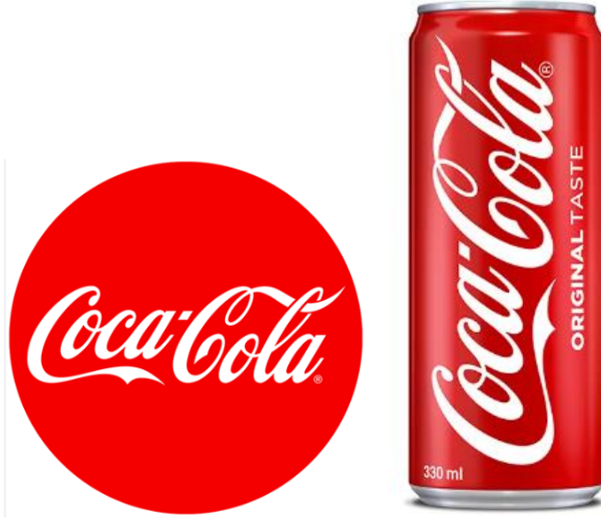
شكل (٤) ألوان كوكاكولا يتماشى مع صورة البراند كمشروب منعش وديناميكي

باللون الأحمر المميز. يثير اللون الأحمر النابض بالحياة مشاعر الطاقة والعاطفة والإثارة، مما يتماشى مع صورة البراند كمشروب منعش وديناميكي.