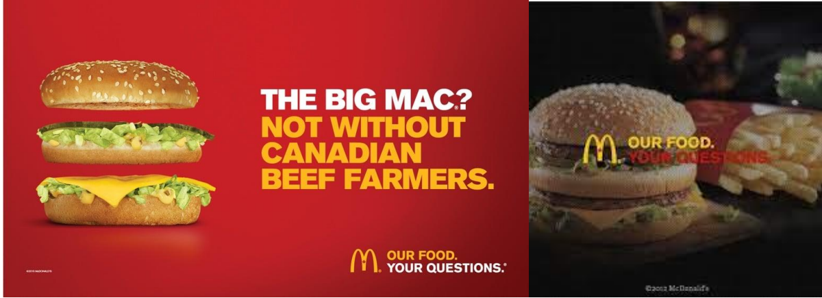
شكل رقم (١٢) حملة ماك دونالدز طعامنا. أسنلتك (Our food. Your questions)

الخاصة بها مصنوعة في الواقع من أبقار حقيقية. يعرف المتلقيون أن ماك دونالدز ليس خيارًا صحيًا، لكنهم ما زالوا يريدون الحقائق لاتخاذ قرارات مستنيرة.