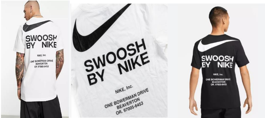
شكل (٣) شعار Swoosh الشهير من Nike

1- تصميم الشعار Logo Design : الشعار هو تمثيل مرئي لشخصية البراند، يجب أن تكون فريدة من نوعها ولا تُنسى وتعكس قيم وشخصية البراند، والتفكير في عناصر مثل الأشكال والرموز والخطوط التي تتوافق مع سمات البراند والجمهور المستهدف، يعد شعار "Swoosh" الشهير من Nike تمثيلاً بسيطاً ولكنه قوي للبراند. إنه يرمز إلى الحركة والسرعة والروح الرياضية، بما يتماشى مع القيم الأساسية لشركة Nike والجمهور المستهدف.