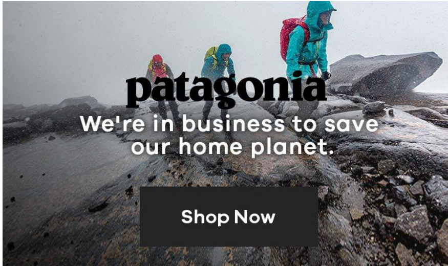
شكل رقم (٢) يوضح رسالة براند Patagonia وفق القيم الاساسية