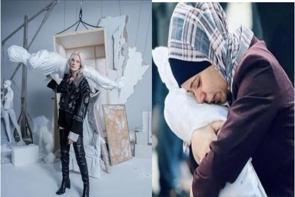
شكل (15) دراسة الحالة شركة زارا ZARA الإسبانية واحداث غزة

قارن الناس بين إعلان الأزياء والصور التي رأيناها من غزة في أعقاب هجمات ٧ أكتوبر التي شنتها حماس في جنوب إسرائيل والحملة الانتقامية اللاحقة التي شنتها إسرائيل في جميع أنحاء غزة، وقد تم مقارنة المشهد ككل بصورة تم ترويجها بعد شهر من العدوان من صحفيين محليين حيث حظيت صورة معينة لأم تعانق ما يبدو أنه طفلها الميت، مغطى بكيس من القماش الأبيض، باهتمام دولي وهو ما خلق ردود فعل عنيفة تجاه زارا التي غيرت قيمها دعماً للعدوان ولم تراعي مشاعر العالم اجمع الذي رفض القتل والعدوان الغاشم