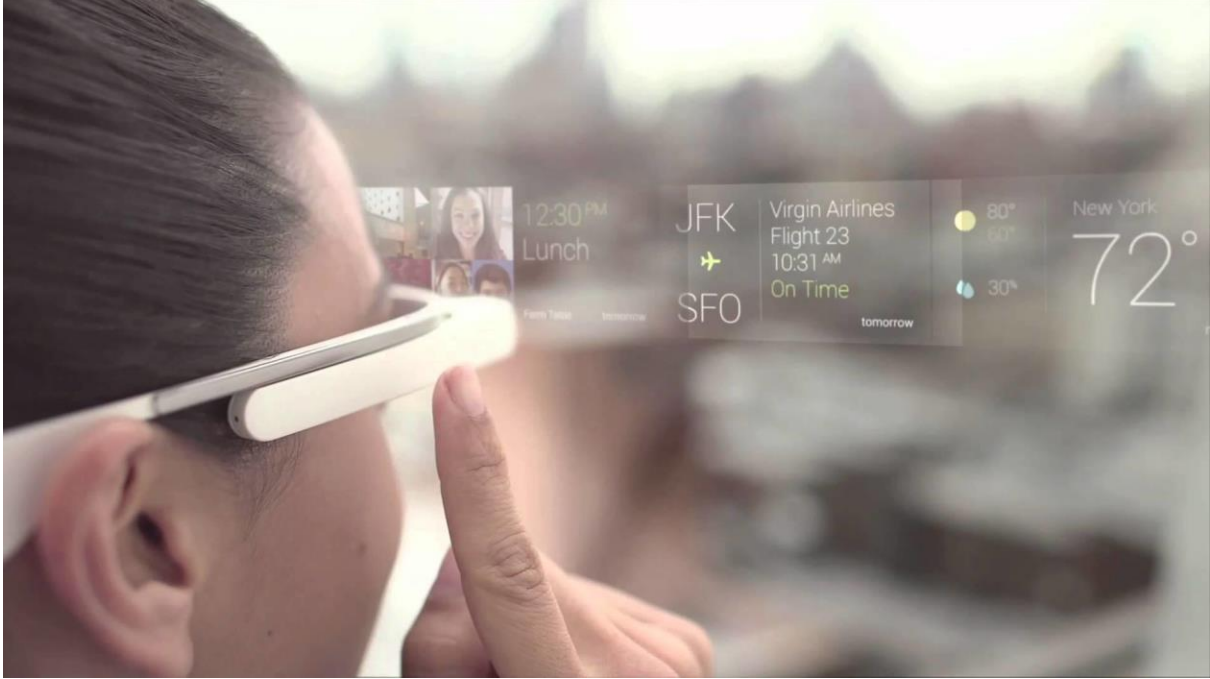
شكل رقم (١١) Google Glass التي غيرت الطريقة التي يعيش بها الناس حياتهم يوميًا