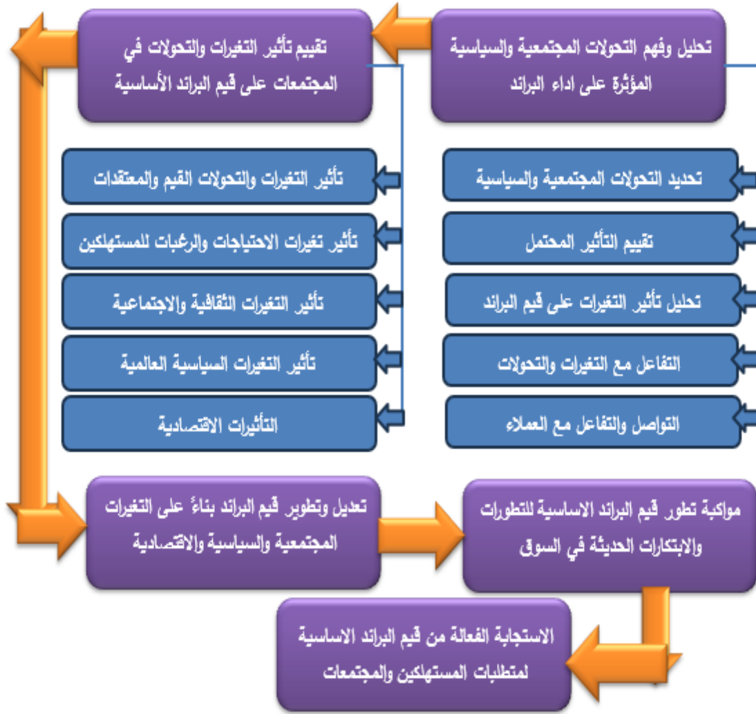
شكل رقم (١٤) مخطط يوضح مراحل الرؤية المقترحة