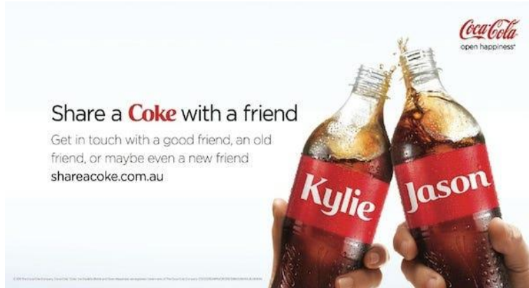
شكل (٧) حملة Share a Coke لتوضيح شخصية البراند