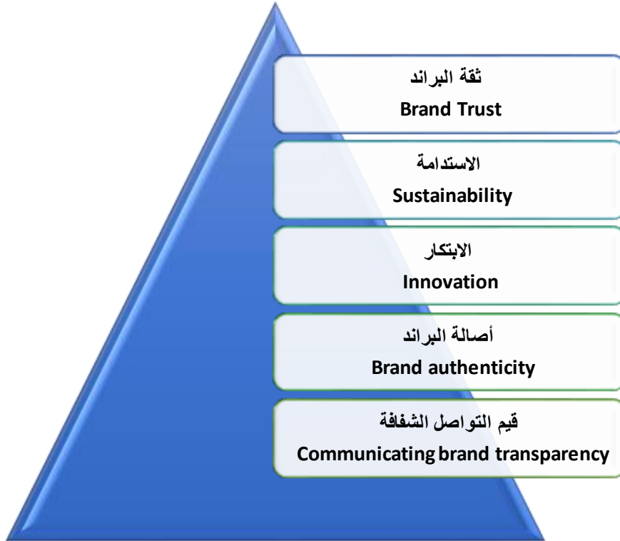
شكل رقم ( ٩ ) مخطط يوضح الجوانب الايجابية في قيم الجمهور تجاه البراند

٢/٤ الجوانب الايجابية في قيم الجمهور تجاه البراند يمكن توضيح الجوانب الايجابية في قيم الجمهور تجاه البراند من خلال المخطط التالي:-