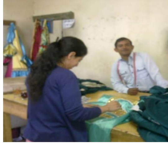
شكل (٢٩) صورة توضح جزء من فريق العمل داخل الورشة من مقص دار و المشرفة على التنفيذ و المعينة بالورشة