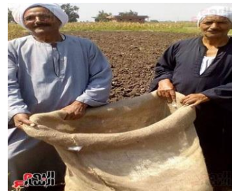
شكل (٨) رجالان يرتديان الجلباب الفلاحي أثناء العمل