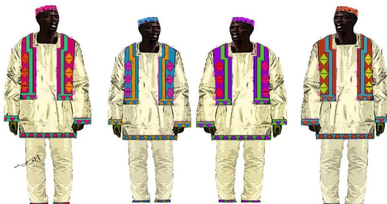
شكل (٢٣) زي رجالي نوبي من تصميم الباحثة مزين بزخارف بألوان مختلفة و صديري بألوان زاهية مختلفة مستوحى من شكل (٦)