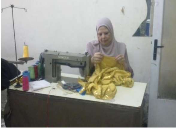
شكل (٣٢) الجلابب الذهبي الصعيدي اثناء تجميعه