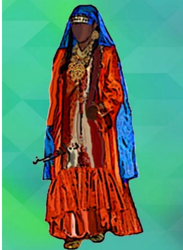
شكل (٢٢) زي نسائي تصميم الباحثة نوبي من لونين سادة مزود بالكرانيش و مطرز و طرحة رأس مطرزة يستخدم في الرقصات النوبي مستوحى من شكل (٦)