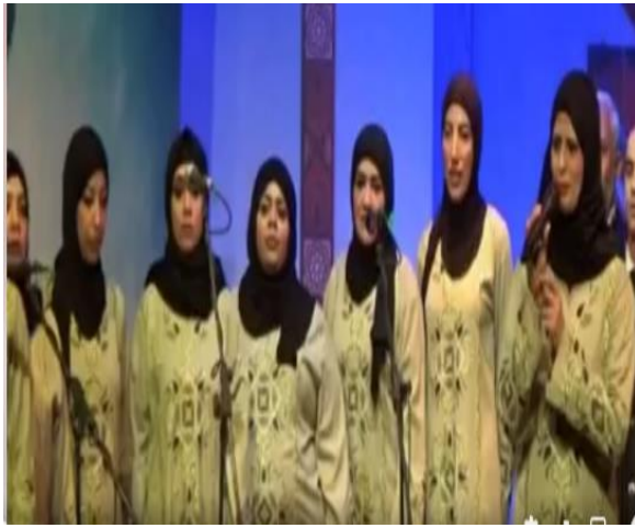
شكل (٦٩) فقرة انشاد دينى بازياء من تصميم الباحثة