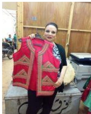
شكل (٥٦) صداري نوبي باللون الاحمر المطرز