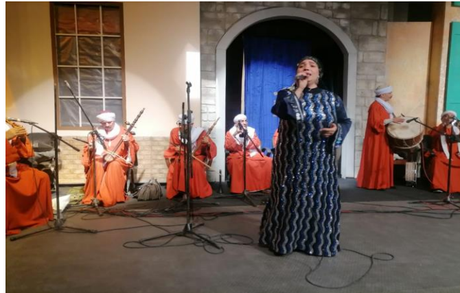
شكل (٦٣) فقرة غناء صعيدى بزى للمطربة من تصميم الباحثة و ازياء من تصميم الباحثة لفرقة الغزف على الآلات الشعبية