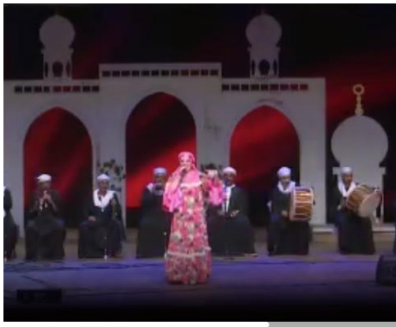
شكل (٧١) فقرة غنائية غناء فلاحى وزى المطربة من تصميم الباحثة