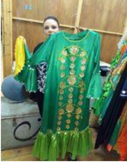
شكل (٤٧) جلباب من الستان الاخضر و مطرز