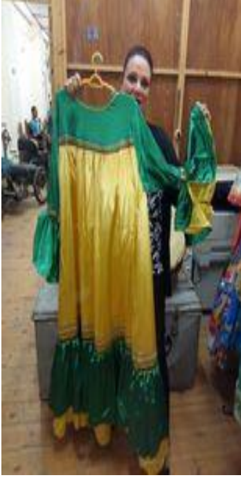
شكل (٤٤) جلباب فلاحى من القماش الستان من لونين الذهبى و الاخضر و مطرز