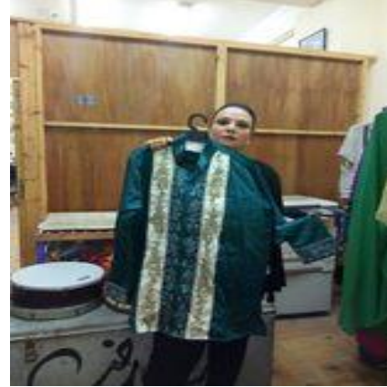
شكل (٥٨) جاكيت رجالي من اللون الاخضر القاتم ومطرز لحفلات الانشاد الديني

١٢ - في ما يلي بعض مشاهد من العروض للفرقة القومية للموسيقى الشعبية و تظهر فيها الازياء التي صممها الباحثة يرتديها الفنانيين