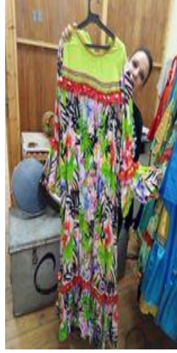
شكل (٤٣) جلباب فلاحى من قماش مزركش و السادة مطرز