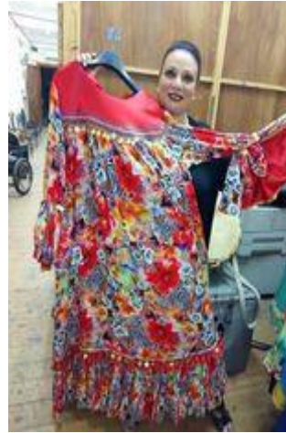
شكل(٣٩) جلباب فلاحي من قماش مزركش و السادة و مطرزة