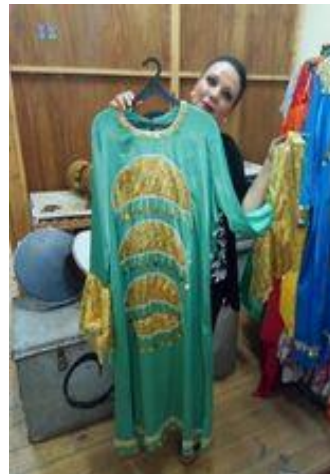
شكل (٥٠) جلباب من الستان من لونين سادة و مطرز