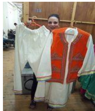
شكل (٥٥) زي رجالي نوبي