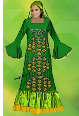
شكل (١٧) زي لاستعراض صعيدي من تصميم الباحثة من قماش الوان سادة مزين بالكرانيش على الاكام و المستوحى من شكل (٥)