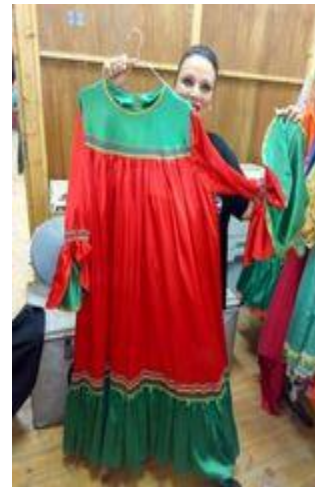
شكل (٣٥) جلابب فلاحى من قماش ستان باللون الاحمر و الاخضر و مطرز