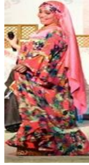
شكل (٦٦) رقص فلاحى بزى تصميم الباحثة