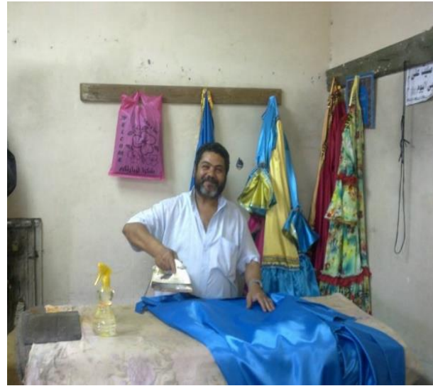
شكل (٣٣) الأزياء بعد الانتهاء من التفصيل يتم كبتها