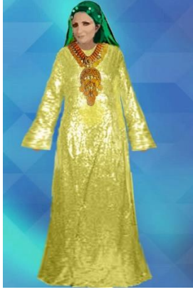
شكل (١٩) زي نسائي من تصميم الباحثة للغناء في حفلات غناء صعيدي و الجلاب من قماش ذهبي مطرز مستوحى من شكل (٥) بالاضافة لطرحة مطرزة