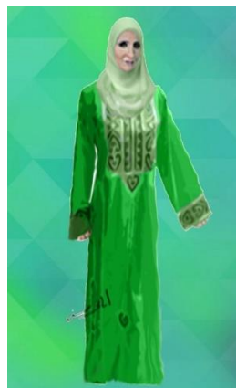
شكل (٢٥) جلاباب اخضر فاتح و مطرز و طرحة سادة من تصميم الباحثة للغناء الديني