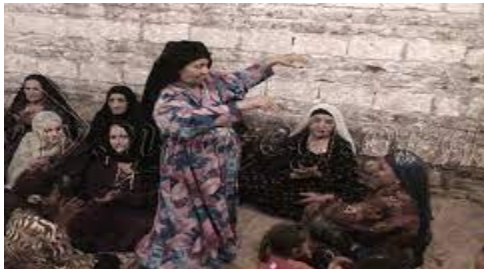
شكل (٥) يوضح الشكل زي لسيدة في محافظة المنيا

و تغلب الألوان المبهجة و الزركشة على الجلباب النسائي في الريف في محافظات الوجه البحري بمصر أكثر من الجلباب النسائي في ريف محافظات الصعيد . (5)