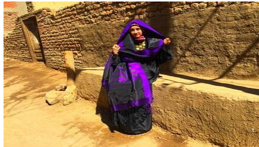
شكل (٤) زي نسائي صعيدى تراثي تفضله سيدات إسنا بالأقصر