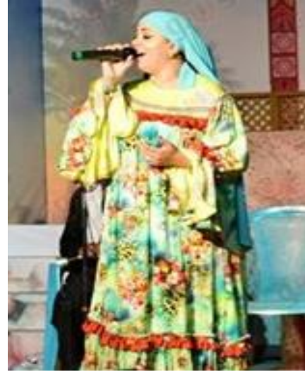
شكل (٦٨) فقرة غناء بزى فلاحى من تصميم الباحثة