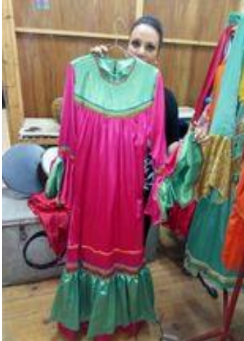
شكل (٤٠) جلباب من قماش ستان مطرز من اللونين سادة