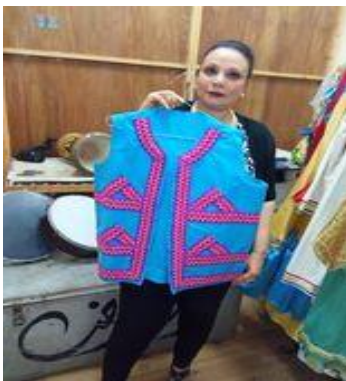
شكل (٥٧) صداري نوبي باللون الازرق