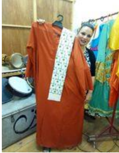
شكل (٥٢) جلباب رجالي صعيدي و كوفية