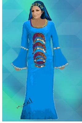
شكل (١٨) زي نسائي من تصميم الباحثة للغناء في فقرات غنائية صعيدي ، الجلاب من لون زاهي و مطرز و معه طرحة ملونه و مطرزة و مستوحى من شكل (٥)