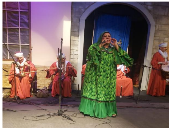
شكل (٦٤) فقرة عزف و غناء بزى للمطربة من تصميم الباحثة و ازياء من تصميم الباحثة لفرقة الغزف على الآلات الشعبية