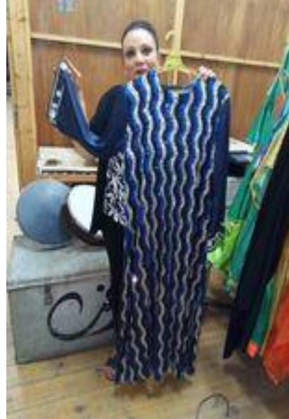
شكل (٤٨) جلباب من قماش مطرز بالترتر و الكمام سادة