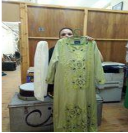
شكل (٥٩) جلباب مطرز لحفلات الانشاد الديني ومعه طرحة