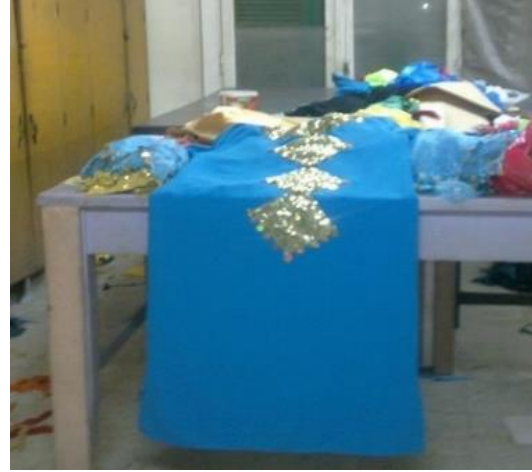
شكل (٣١) الزي بعد الانتهاء من تطريزه اثناء التنفيذ