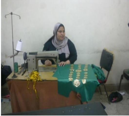
شكل (٢٨) جزء امامي مطرز من زي نسائي صعيدى اثناء الخياطة