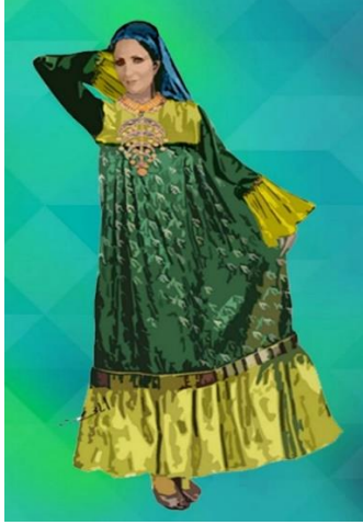
شكل (١٤) زي فلاحى نسائي يشمل جلباب مزركش له اكام بكرانيش من لون سادة و مطرز بالاضافة لطرحة رأس ملونة و مطرزة مستوحى من شكل رقم (٣)