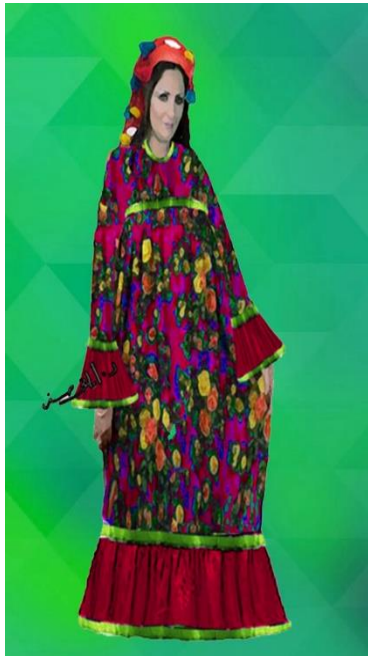
شكل (١٢) زي فلاحى نسائي يشمل جلباب مطرز و مندبل رأس المعروف باسم ( مندبل بايه ) مستوحى من شكل رقم (٢)

و في ما يلي تعرض الباحثة نماذج من الازياء التي قامت الباحثة بتصميمها و قامت ورشة ازياء البيت الفني للفنون الشعبية و الاستعراضية بتنفيذها و ارتداها فئاتي فرقة الفرقة القومية للموسيقى الشعبية و الإنشاد الديني في الاحتفالات و العروض الغنائية و الاستعراضية في الموسم الصيفي ٢٠٢٣ ٤ - تصميمات الباحثة لازياء فلاحى نسائي للغناء و الرقص