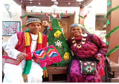
شكل (٦) زيات سيدات ورجل من النوبة 20-1-2023

https://brandnubiankings.wordpress.com/2018/12/23