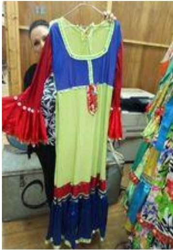
شكل (٥٤) جلباب نوبي مطرز