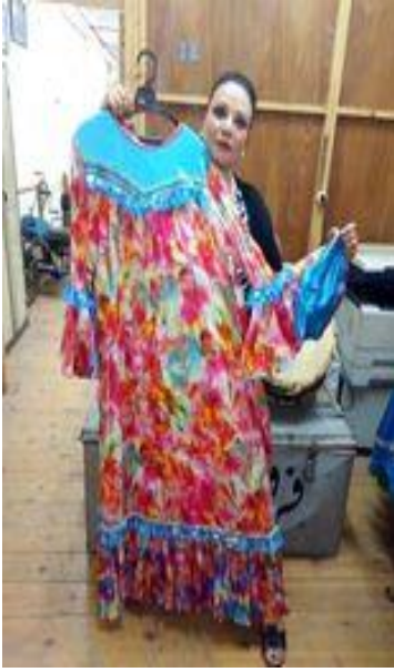
شكل (٣٨) جلباب فلاحي من القماش مشجر و السادة و مطرز