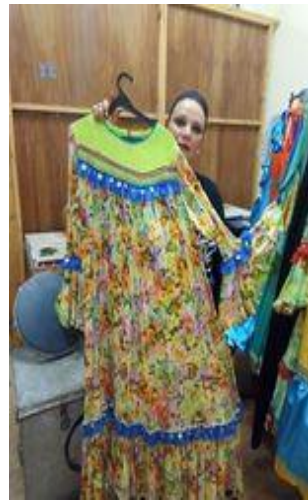
شكل(٤١) جلباب فلاحي من قماش مزركش و سادة و مطرز