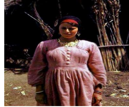
شكل (١) زي فلاحية مصرية يناير ٢، ٢٠١٦ - ٥:٣٥ م /https://lite.almasryalyoum.com/lists/81659

كما ترتدي الفلاحات ملابس من الأقمشة الامعه و المزركشة في الافراح و المناسبات السعيدة ، وتكون مطرزة بالاشترطة الملونة و الخرز ، كما تستخدم القرويات مندبل الرأس المثلث الشكل المطرز، المعروف باسم المندبل (أبو أوية)