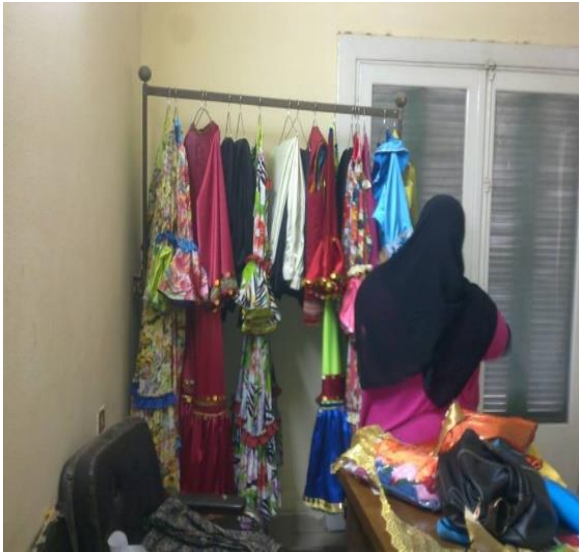
شكل (٣٤) مجموعة من الأزياء بعد الانتهاء من تفصيلها