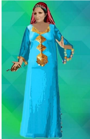
شكل (١٦) زي من تصميم الباحثة لمطربة للغناء صعيد و الجلباب من قماش سادة و مطرز و مستوحى من شكل (٤)