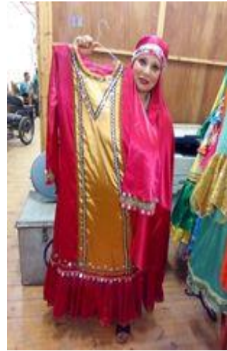
شكل (٥٣) زي نوبي من القماش الستان لونين سادة و مطرز