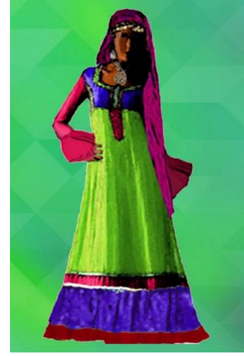
شكل (٢٠) زي نوبي تصميم الباحثة من الوان سادة زاهية و مطرز بالاضافة لطرحة رأس مطرزة للاستعراضات مستوحى من شكل (٧)