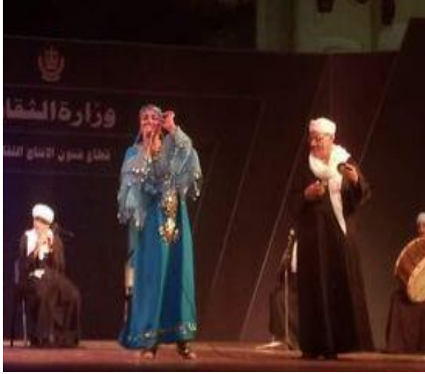
شكل (٦٧) فقرة غناء صعيدية بزى للمطربة من تصميم الباحثة