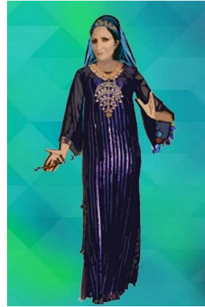
شكل (١٥) زي نسائي تصميم الباحثة منيستخدم في حفلات غناء صعيدي الجلباب من قماش ازرق و فضي لامع مطرز و ترتدي معه طرحة مطرزة المستوحى من شكل (٤)