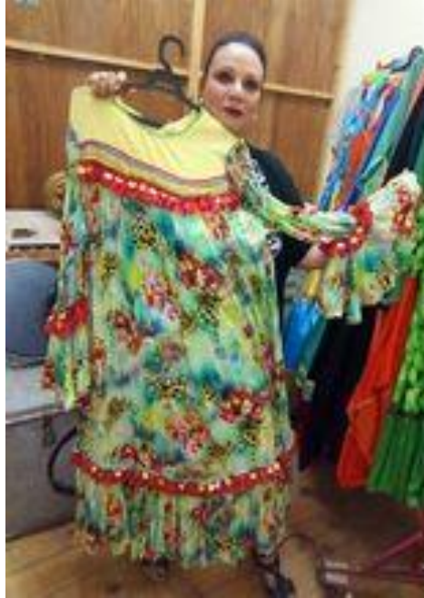
شكل (٤٥) جلباب فلاحى من القماش المزركش