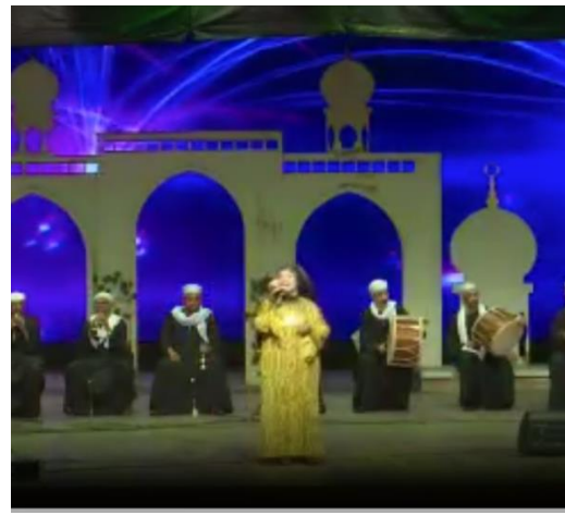
شكل (٧٠) فقرة غنائية غناء صعيدى وزى المطربة من تصميم الباحثة