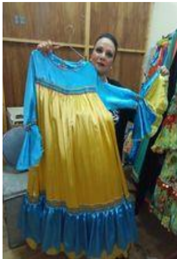
شكل (٤٢) جلباب فلاحي من الستان الأصفر و الازرق و مطرز