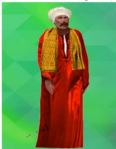
شكل (٢٤) زي صعيدي من تصميم الباحثة لفرقة الاالات الشعبية جلاباب صعيدي و عمامه و كوفية مستوحى من شكل (١٠)