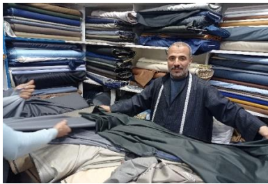
شكل (٩) ترزي من قرية ديبى بالبحيرة يعرض مجموعة من الوان

يرتدي الرجال في محافظات الدلتا العمامة و لاسة و اللبدة و الطاقة على الرأس (4)