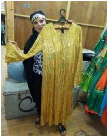
شكل (٥١) جلباب من قماش مطرز بالترتر ذهبي