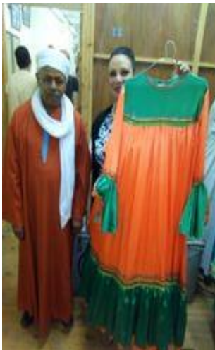
شكل (٣٦) جلابب فلاحى من القماش الستان البرتقالي و الاخضر و مطرز