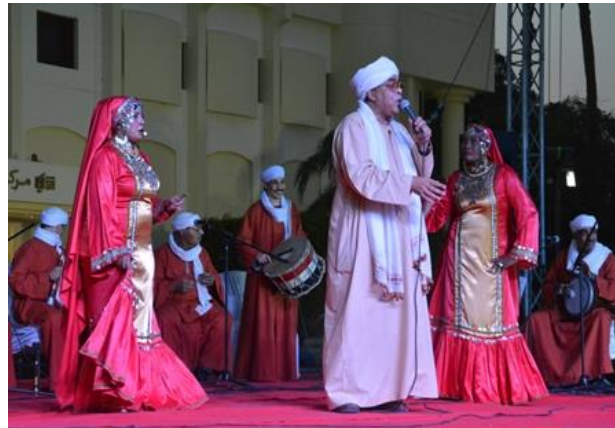
شكل (٦١) فقرة غناء و رقص نوبي بالزبلء من تصميم الباحث