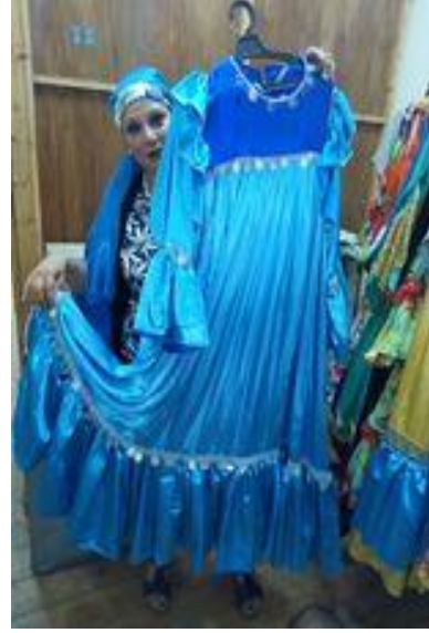
شكل (٣٧) جلباب من القماش الستان من درجتين من اللون الزرق