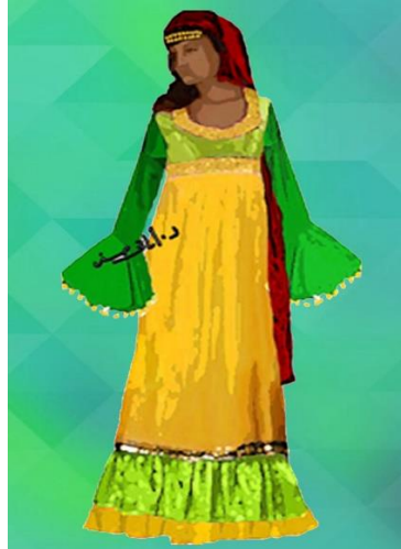
شكل (٢١) زي نسائي نوبي تصميم الباحثة من ألوان مختلفة زاهية و مطرز للغناء و الرقص مستوحى من شكل (٧)