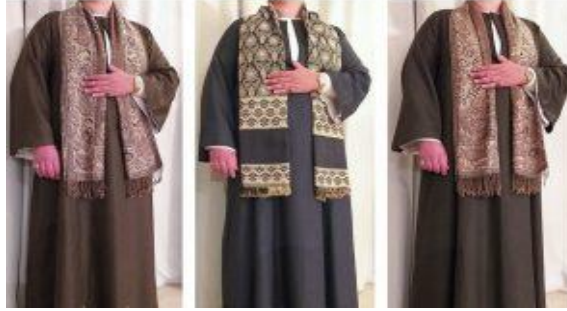
شكل (١٠) زي صعيدي رجالي بالوان مختلفة 1:21:42 2021/07/27 مساءً

○ الكوفية والنشال الكشمير : يرتدي الرجال في محافظات الصعيد الكوفية أو «اللاساة» وتوضع على الكتف أو تُلف على الرأس أو فوق العمة ، أما النشال الكشمير فيوضع على الكتف ناحية الشمال كمنظر مكمل للجلباب (٧).