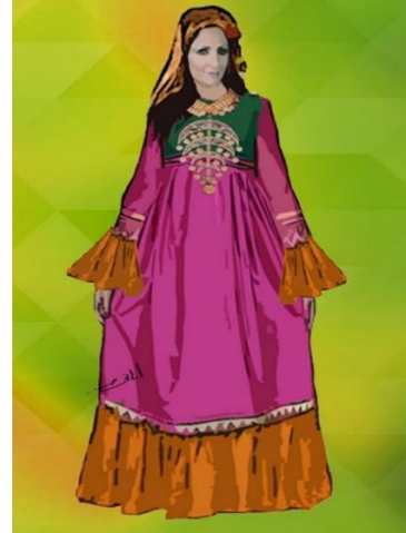
شكل (١٣) زي فلاحى نسائي يشمل منديل رأس باويه و طرحة ملونه و مطرزة و الجلباب من لونين مستوحى من شكل رقم (١)