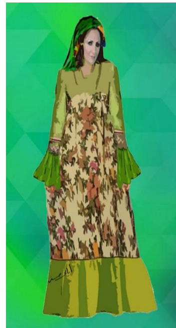
شكل (١١) زي فلاحى نسائي يشمل مندبل مطرز و طرحة ملونة و الجلباب مطرز من القماش السادة و المزركش مستوحى من شكل رقم (٣)