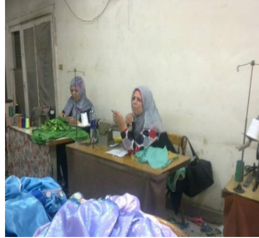
شكل (٢٧) تجميع اجزاء الزي على ماكينه الخياطة