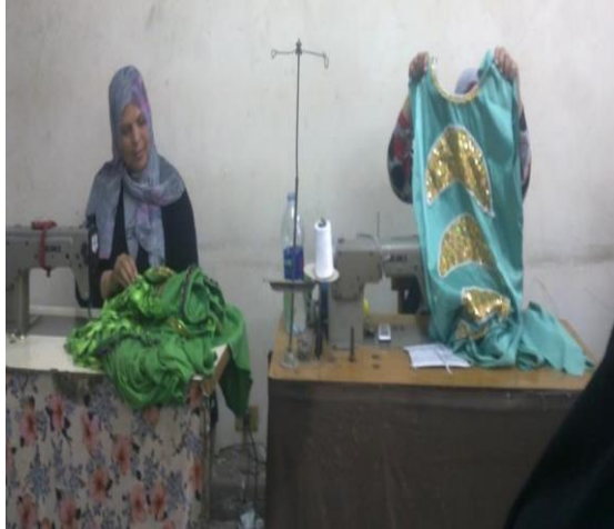
شكل (٣٠) احد الخياطات تعرض الجلاب اثناء تجميعه علي ماكينة الخياطة