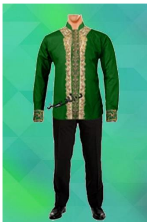
شكل (٢٦) قميص مطرز على الياقة و الصدر و اكمام طويلة الاسورة مطرزة من تصميم الباحثة للغناء الديني