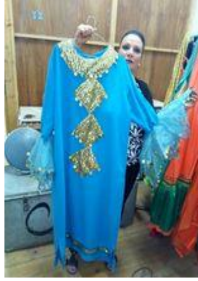
شكل (٤٦) جلباب من القماش الستان و الشيفون و مطرز