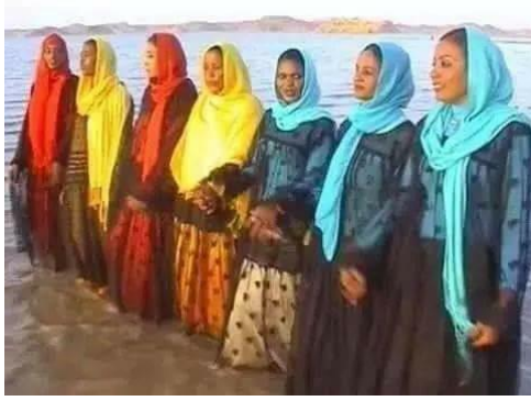
شكل (٧) مجموعة من زيات سيدات من النوبة

https://brandnubiankings.wordpress.com/2018/12/23