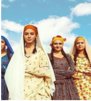
شكل (٣) ملابس فلاحية مصرية من الأقمشة المزركشة ومطرز بالاشترطة الملونة https://raseef22.net/article/1079824