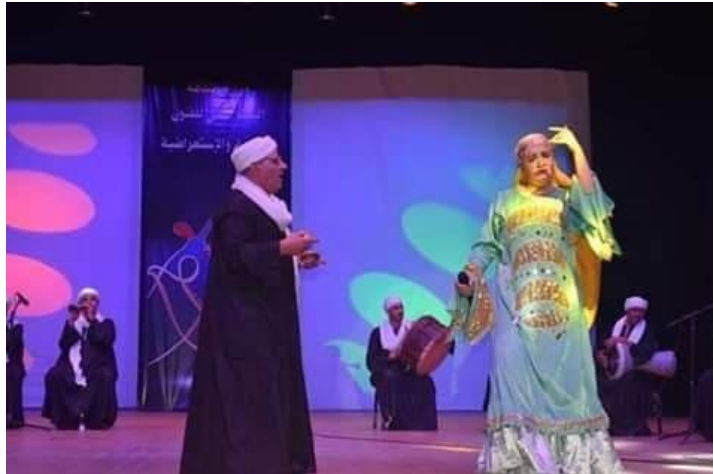
شكل (٦٥) فقرة غناء و رقص صعيدى و زى المطربة من تصميم الباحثة