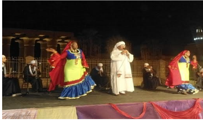
شكل (٦٠) فقرة استعراضية و غنائية نوبي بالازياء من تصميم الباحثة

١٢ - في ما يلي بعض مشاهد من العروض للفرقة القومية للموسيقى الشعبية و تظهر فيها الازياء التي صممها الباحثة يرتديها الفنانيين