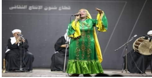
شكل (٦٢) فقرة غناء صعيدى بزى من تصميم الباحثة