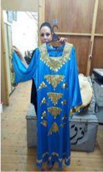
شكل (٤٩) جلباب من القماش الزرق الستان و مطرز