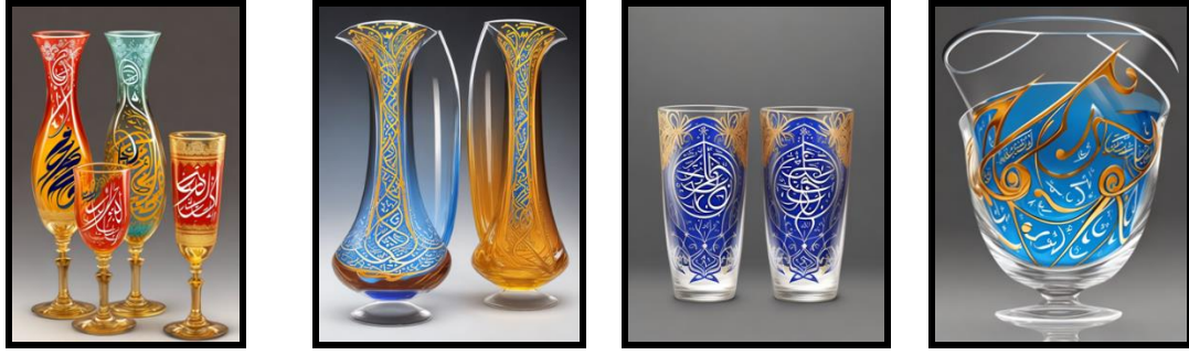
الشكل رقم (٤) مجموعة مشغولات طباعية على الزجاج، استخدمت فيها تقنية الطباعة بماكينات الطباعة الرقمية