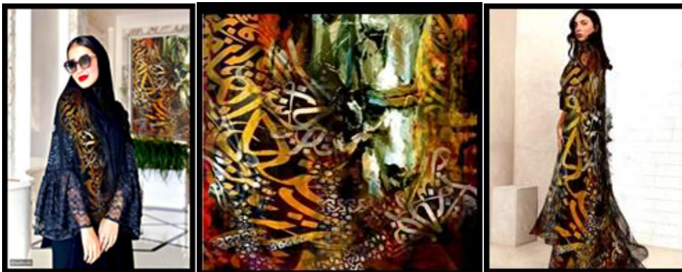
الشكل رقم (٦) مجموعة متنوعة من الأزياء ومكملاتها استخدم في إخراجها تقنية الطباعة بالشاشة الحرارية.

مجموعة متنوعة من الأزياء ومكملاتها استخدم في إخراجها تقنية الطباعة بالشاشة الحريرية، بهدف التنوع في المشغولات الطباعية والوظائف المستخدمة لإثراء المشروعات الصغيرة، والتنوع في منتجات الطباعة، ويوضح الشكل رقم (٦) مجموعة متنوعة من الأزياء ومكملاتها استخدم في إخراجها تقنية الطباعة بالشاشة الحرارية.