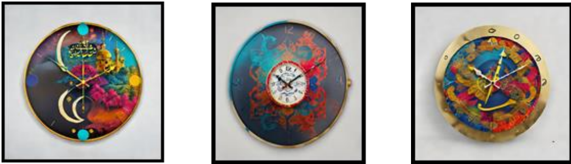
الشكل رقم (٥) منتجات مختلفة المجالات، سواء كانت وظيفية أو تجميلية بالطباعة الحرارية الرقمية الحديثة

هي عبارة عن مجموعة مشغولات طباعية من (الساعات الحائطية كطباعة علي الخشب والمفارش كطباعة علي الاقمشة)، استخدمت فيها تقنية الطباعة بماكينات الطباعة الحرارية الحديثة، بهدف إدخال التكنولوجيا في تجربة الدراسة، وذلك لدعم الإنتاج الكمي والكيفي الذي يناسب سرعة الإنتاج والجودة العالية، والتي تعتبر من المتطلبات اللازمة في المشروعات الصغيرة، وتصميمات هذه المجموعة عبارة عن منتجات مختلفة المجالات، سواء كانت وظيفية أو تجميلية طباعة الحرارية الرقمية الحديثة، يوضح الشكل رقم (٥) منتجات مختلفة المجالات، سواء كانت وظيفية أو تجميلية بالطباعة الحرارية الرقمية الحديثة