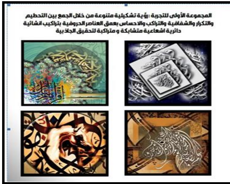
شكل رقم (١) لوحات طباعية معاصرة بماكينات النقل الحراري مستوحاه من الحروف العربية والزخارف الاسلامية