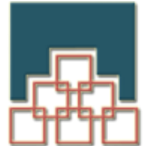
شعار الرمز brand mark