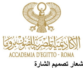
شعار تصميم الشارة Emblem mark