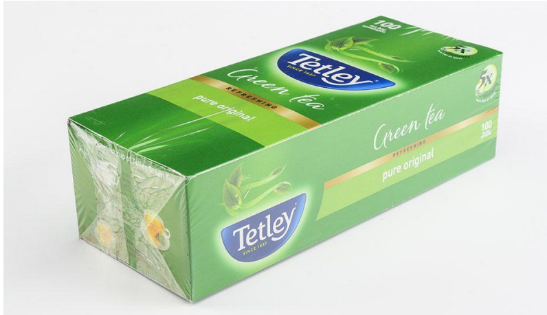
شكل (٦) : الأغلفة الفيلمية لعبوات الكرتون المطوي (٤)، (٥)