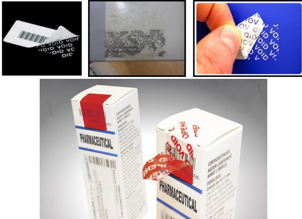
شكل (٣): الملصقات ذاتية الأثر المقاومة للعبث على العبوة VOID (٢)

هذا النوع من الملصقات بمجرد نزعها، تنقل الرمز "VOID" على سطح العبوة، تاركة دليلاً واضحاً على الفتح ، ولا يسمح للملصق من الالتصاق مرة اخري دون أن تصبح الإزالة واضحة. ومن الممكن وضع كتابات مختلفة مثل "OPEN" أو "GENUINE PRODUCT" على المادة اللاصقة المنقولة (٢) ويوضح شكل (٣) الملصقات ذاتية الأثر المقاومة للعبث على العبوة VOID