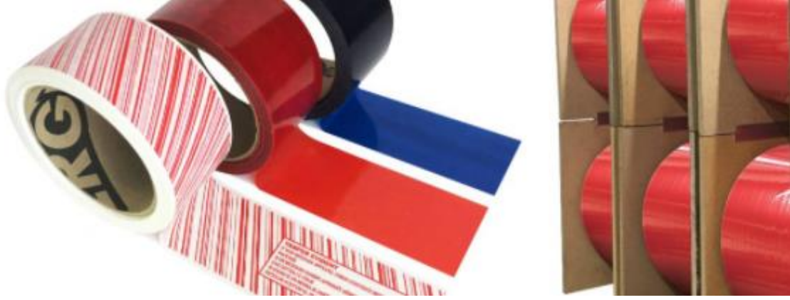
شكل (٤) : خامة الملصقات ذاتية الأثر المقاومة للعبث VOID (٢)

ويوضح شكل (٤) خامة الملصقات ذاتية الأثر المقاومة للعبث VOID