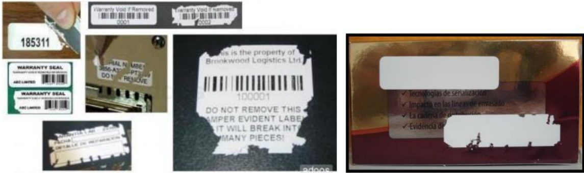
شكل (٥) : ملصقات الفينيل متعددة التدمير (١)

هذه الملصقات مصنوعة من مادة تدمر نفسها إلى أجزاء صغيرة في حالة محاولة نزعها حيث تستخدم معها خامات هشة وضعيفة يسهل تدميرها بمجرد الفتح وتتحول الي قطع صغيرة. (١) ويستخجم الفينيل نظراً لفاعليته وأنه أقل تكلفة كما ظهر حديثاً بوليمرات اصطناعية لديها خواص قوة ميكانيكية تكسبها مقاومة ضعيفة للتمزق. ويوضح شكل (٥) ملصقات الفينيل متعددة التدمير.