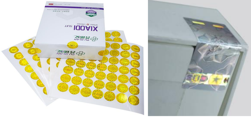
شكل (٧) : الملصقات الهولوجرامية ثلاثية الأبعاد (٣)

ويوضح شكل (٧) الملصقات الهولوجرامية ثلاثية الأبعاد