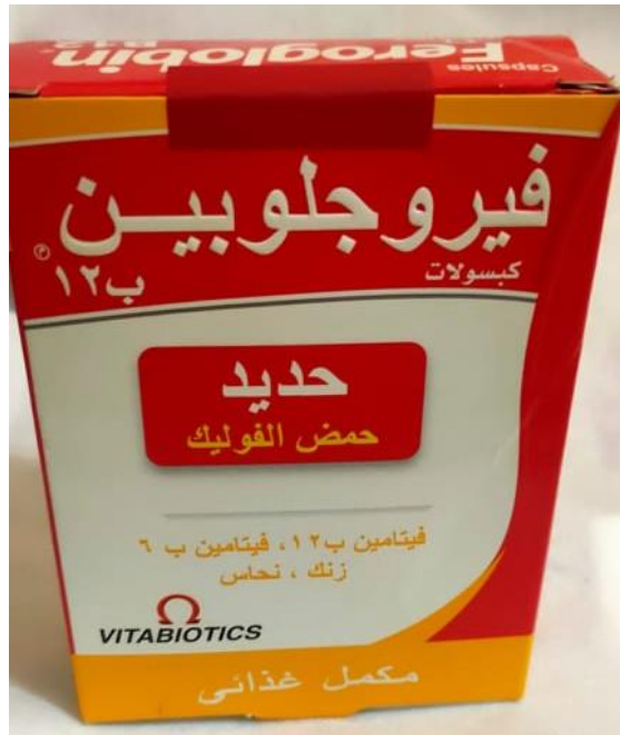
شكل (٩) : ملصق الامان المقاوم للعبث عند تثبيته علي العبوة.

وبالتالي تم تطبيق ملصق الامان المقاوم للعبث على العبوة حيث يحتوي علي نص مدمج فيها وعندما يتم ازلتها فانها تعرض كلمة تجنب void في الطبقة اللاصقة اللي تركت خلفها . ويوضح شكل (٩) ملصق الامان المقاوم للعبث عند تثبيته علي العبوة. ويوضح شكل (١٠) ملصق الامان عند محاولة ازالته فيحدث تشوه للملصق ويعطي علامة تدل علي الفتح , وبالتالي لا يمكن اعاده بيع أو تعبئة العبوة مره أخرى .