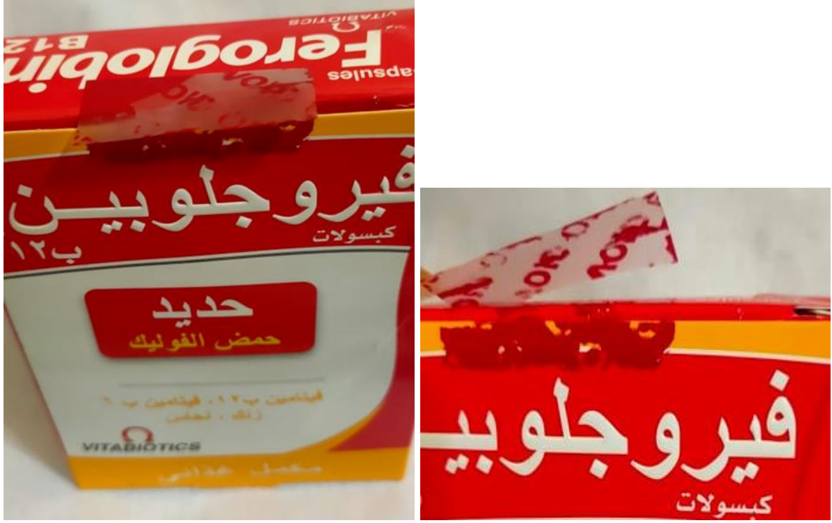
شكل (١٠) : ملصق الأمان عند محاولة ازالته فيحدث تشوه للملصق ويعطي علامة تدل علي الفتح , وبالتالي لا يمكن اعاده بيع أو تعبئة العبوة مره أخرى .