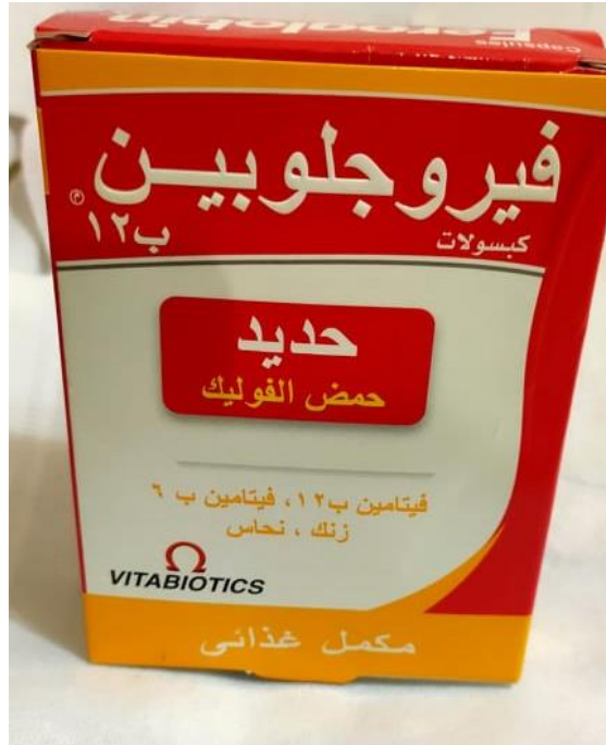
شكل (٨) : عبوة دواء فيروجلوبين feroglobin قبل اضافته الملتصقات المقاومة للعبث.

ويوضح شكل (٨) عبوة دواء فيروجلوبين feroglobin قبل اضافته الملتصقات المقاومة للعبث.