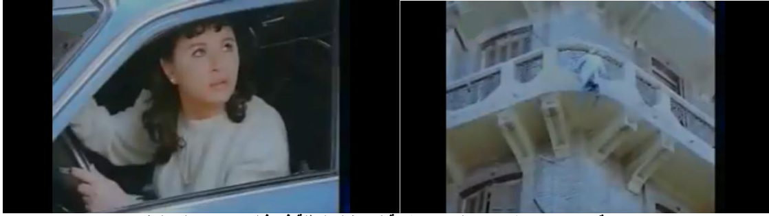
صورة رقم ( ١٢ ) حدث خارج السياق علامة لمستقبل البطلة في فيلم "موعد على العشاء"

وفي مثال مضاد في رسالته عن المثال السابق فقد خلق محمد خان مشهداً منفصلاً عن أحداث فيلم " في شقة مصر الجديدة " عندما كانت البطلة في محطة القطار تكرر محاولة رجوعها إلى بلدتها ، حيث أدخل خان مشهد ولادة طفل على يد البطلة في صدفه ، معبراً عن حالة الفرح لتحفل معه ببهجة الحياة تصل إلى حد البكاء . فكان علامة لأمل لها في المشاهد التالية . صورة رقم. (13)