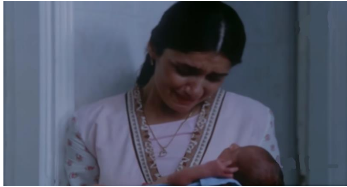
صورة رقم (١٣) حدث سعيد خارج سياق الأحداث علامة للتفانل في الأحداث التالية في الفيلم

وفي مثال مضاد في رسالته عن المثال السابق فقد خلق محمد خان مشهداً منفصلاً عن أحداث فيلم " في شقة مصر الجديدة " عندما كانت البطلة في محطة القطار تكرر محاولة رجوعها إلى بلدتها ، حيث أدخل خان مشهد ولادة طفل على يد البطلة في صدفه ، معبراً عن حالة الفرح لتحفل معه ببهجة الحياة تصل إلى حد البكاء . فكان علامة لأمل لها في المشاهد التالية . صورة رقم. (13)