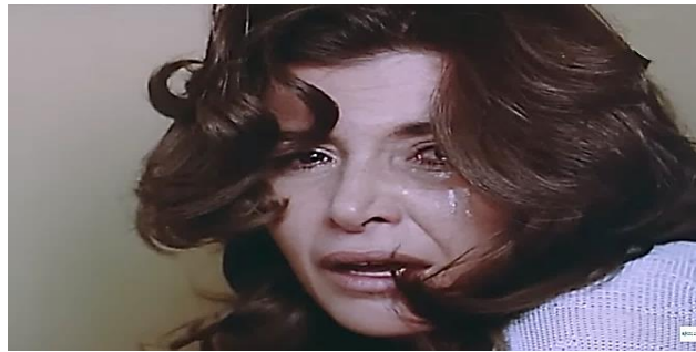
صورة رقم (٣) لقطه النهايه في فيلم " زوجة رجل مهم"

و يتحول الصمت في مشهد النهايه لبقعة ضوء على آخر حدث في الفيلم ولانتهاء حياة البطل ، وكأن صمت البطله الذي استمر ٢٤ ثانيه يحل محل لقطات الموت ويعبر عنها . صورة رقم(3)