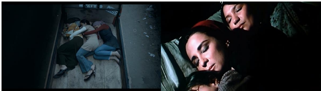
صورة رقم (١٤) التكوين البصري علامة لاسلوب محمد خان

أحياناً ما يكرر محمد خان علاماته البصرية ليخلق له أسلوبه الخاص ، فتصبح داله على أعماله ، علامات لها دلالة واحدة أي معنى واحد ، و لعل أشهرها التكوين المرئي الذي يعبر عن نظرتة المتعاطفة للمرأة وتضامنهن مع بعضهن . هذا التكوين المتكرر في فيلمي " فتاة المصنع " و " أحلام هند وكاميليا " . فهي رؤية خان اتجاه صمود المرأة و تكاتفهم في أوقات المحن صورة رقم. (14)