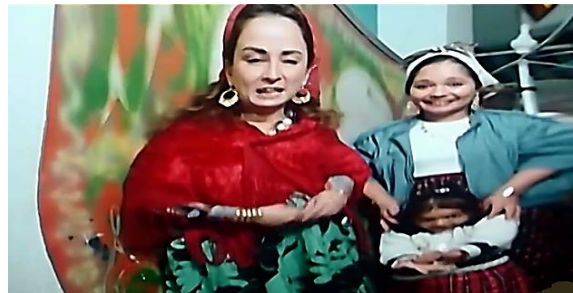
صورة رقم (٦) الانعكاس المشوه لطلتي فيلم " أحلام هند وكاميليا" معبراً عن حياتهما

-في فيلم " طائر على الطريق " كانت انعكاسات مرايا العربية لنظرات البطلين هي وسيلة التواصل الأولى بينهم قبل بداية الحوار ، ثم يأتي الأخير ليشرح للمتفرج شكل تلك النظرات . صورة رقم.(7)