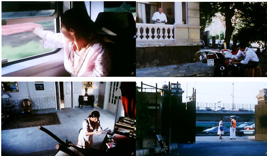
صورة رقم (١) بعض الكادرات المتنوعة من فيلم " في شقة مصر الجديدة"

مثل ما قدمه في فيلم " في شقة مصر الجديدة " ، فكانت أغلب كادرات الفيلم واسعة يحتل الفراغ جزء كبير منها والزوايا المنفرجة ( صورة رقم (1) ، وحركة الكاميرا هادئة بطيئة ليرمز إلى اسلوب الحياة وطبيعة الشخصية لبطله الفيلم.