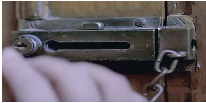
صورة رقم (١٦) تطويل الزمن كعلامة للتأهب في فيلم "زوجة رجل مهم"

المسافة الزمنية للقرع الجرس وفتح الباب في المشهد الاخير لفيلم " زوجة رجل مهم " هي أفضل مثال لتوصيل الرسالة من خلال الزمن الطويل . فبالنسبة لقرع الجرس نجد أن الزمن أطول من الحدث ولكن يوصل لنا حالة التأهب و الاستعداد لمصير بطلة الفيلم و نهاية القيود عليها ( فتح قفل الباب ) . صورة رقم. (16)