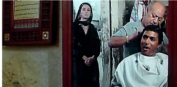
صورة رقم (٥) انعكاس بطلي فيلم " احلام هند و كاميليا " على المرايا

في فيلم " أحلام هند وكاميليا " نرى لقطة المواجهة بين بطلي الفيلم من خلال مرايا ، و هي علامة لتلك المواجهة وكأن خان يكشف البطلين كل واحد لدى الآخر ولا يستطيع أحدهم التخفي من الآخر . صورة رقم.(5)