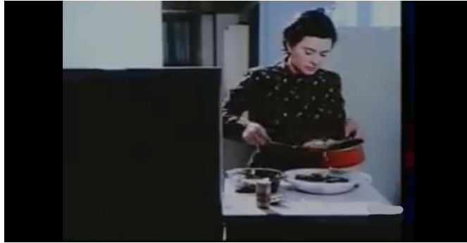
صورة رقم (١٥) تطويل الزمن كعلامة اصرار في فيلم "موعد على العشاء"

أنه كان علامة لها معنى ، وبه تؤكد لنا البطلة بصدقها على قرار القتل برغم الزمن الطويل دون أي تراجع ، والمتلقي ينفعل مع طول الزمن فحبه الانتقام للبطلة وتعاطفه معها . صورة رقم. (15)