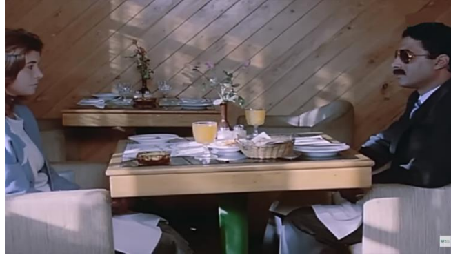
صورة رقم ٢ لحظات صمت في مشهد من فيلم " زوجة رجل مهم"

أيقن خان أهمية اضافة عدد من الفريمت يملنها الصمت ، واستغلها في إعطاء الاحساس برتابة الحياة لدى بطلي فيلم "زوجة رجل مهم" ، فكانت هناك مشاهد كامله يجمع بين الزوجين تنتهي بلحظات صمت تعبر عن الرتابه مع الترقب لشيء ما سوف يحدث . ففي مشهد لصلح الزوجين اصبح للصمت مكاناً للقطه بذاته أي يحدث القطع ليبدأ لقطه صمت فقط . ( صورة رقم ٢ )