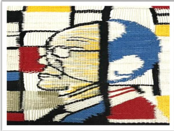
المعلقة النسجية الرابعة