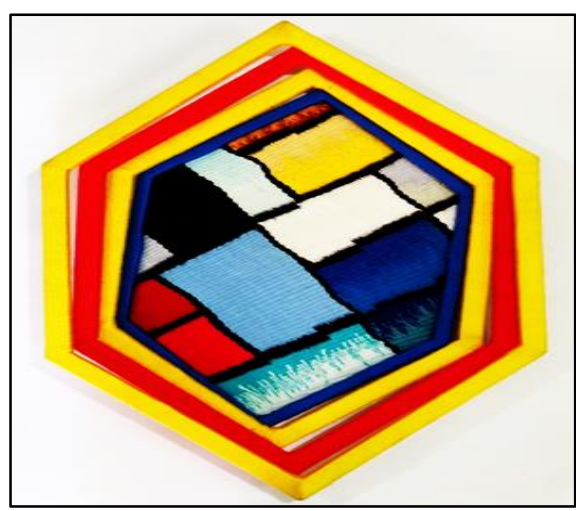
المعلقة النسجية الحادية عشر