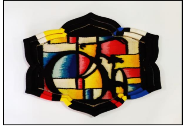
المعلقة النسجية الأولى