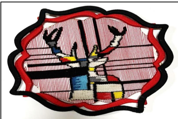
المعلقة النسجية السادسة