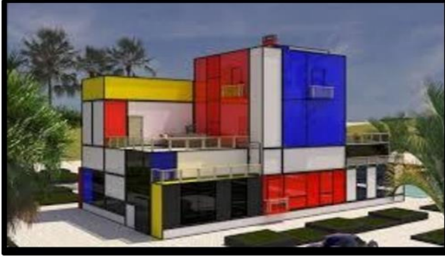
صورة رقم (٢) نموذج من تصميمات العمار والقرى السياحية بتصميمات هندسية مستوحاه من أعمال موندريان