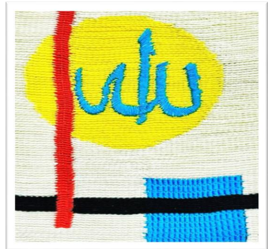
المعلقة النسجية الخامسة عشر