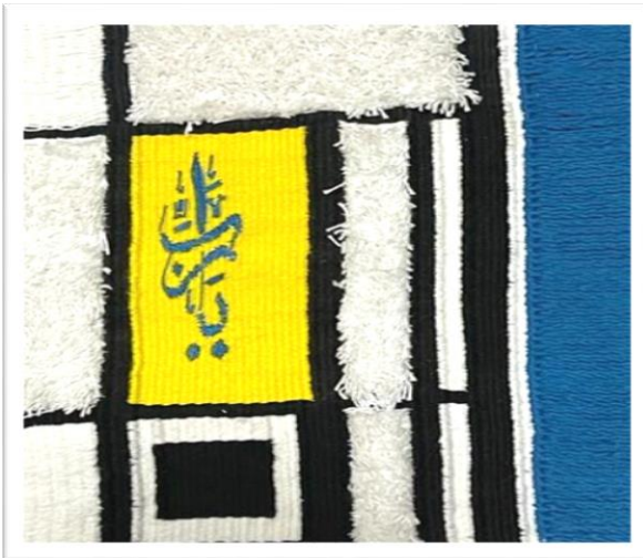
المعلقة النسجية السادسة عشر