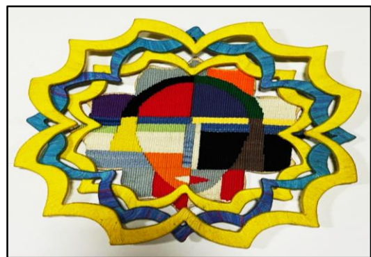
المعلقة النسجية السابعة عشر