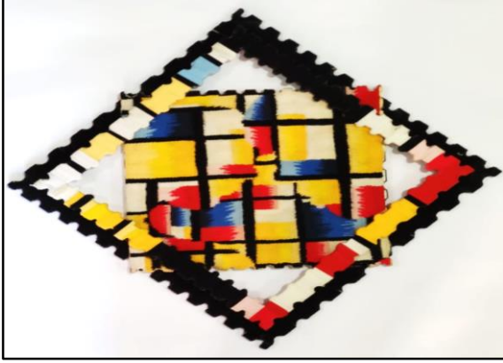
المعلقة النسجية الثانية

المحور الأول: تناول أسلوب موندريان مع إضافة عناصر (عضوية أو غير عضوية)، (بارزة أو مسطحة) للمعلقات النسجية