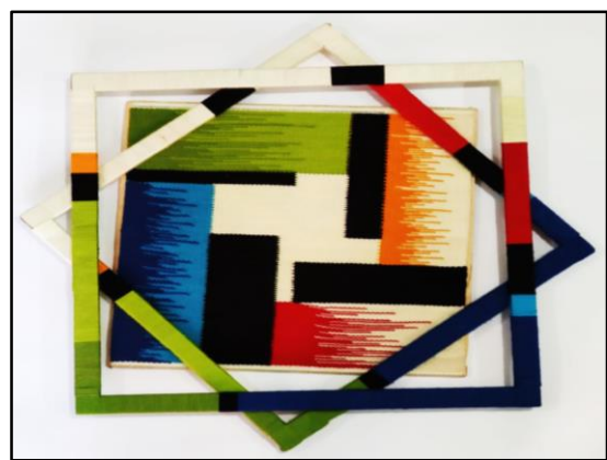
المعلقة النسجية التاسعة