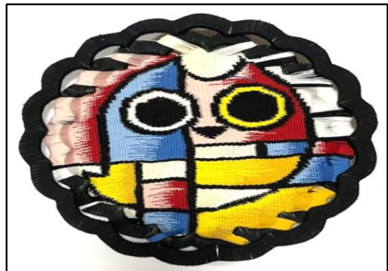
المعلقة النسجية الخامسة