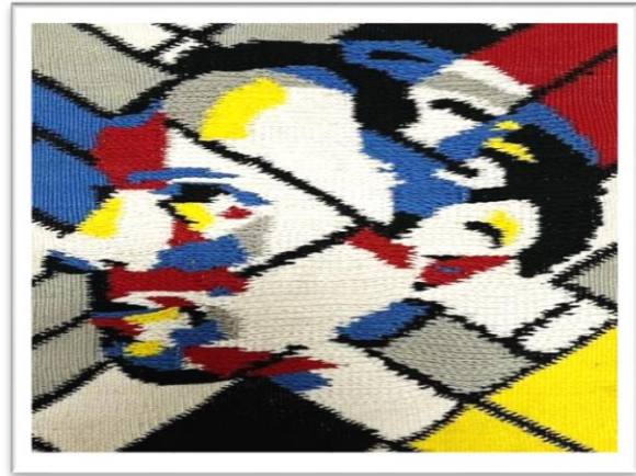
المعلقة النسجية الثالثة