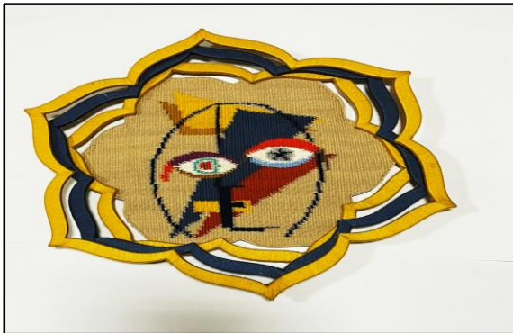
المعلقة النسجية الثامنة عشر

المحور الثالث: تناول أسلوب موندريان في معالجته للموضوع مع تغيير المجموعات اللونية.