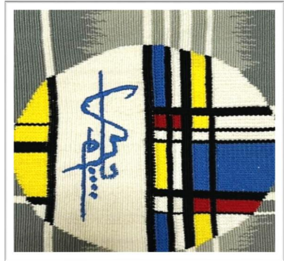
المعلقة النسجية الثالثة عشر